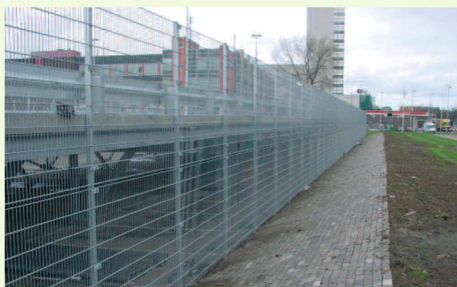
Gevelhekwerk dubbelstaafs matten