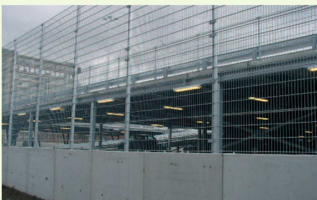
Gevelhekwerk dubbelstaafs matten